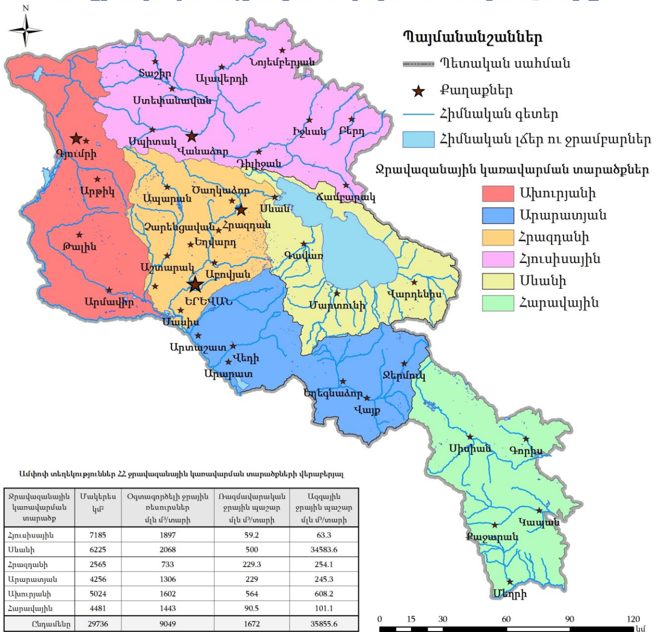
Նկար 1 – Հայաստանի ջրավազանային կառավարման տարածքները

Ջրավազանային տարածքային կառավարման բաժինները պատասխանատու են ավազանային մակարդակով ջրավազանային կառավարման պլանների մշակման, ջրօգտագործման թույլտվությունների գրանցման, ջրային ռեսուրսների պահպանության ապահովման, ջրօգտագործման թույլտվություններով ամրագրված պայմանների իրավակիրարկման, ջրառի ռեժիմի սահմանման, ինչպես նաև ստեղծված վեց ջրավազանային կառավարման տարածքների համար ջրային ռեսուրսների բաշխման պլանների մշակման համար: