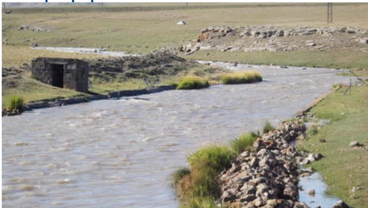
This project is implemented by a Consortium le