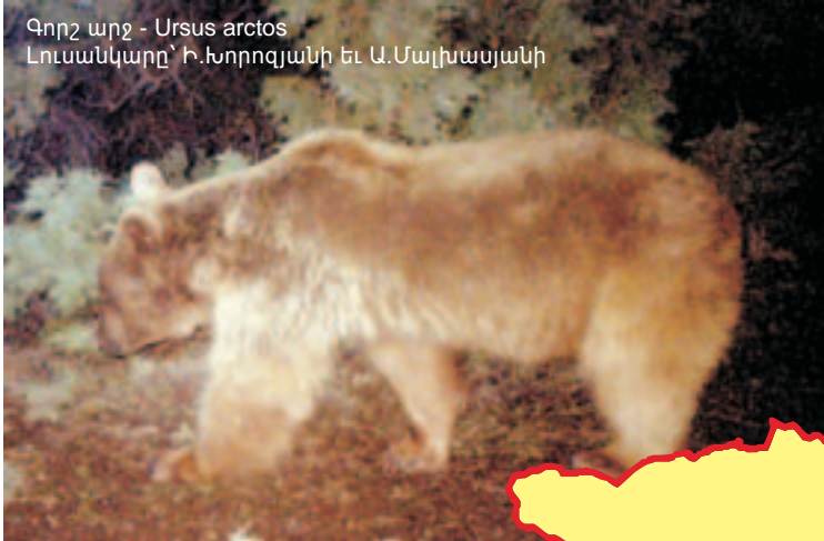
Գորշ արջ - Ursus arctos

Սույն հրատարակությունը իրագործվել է «Հայ կանաչք հանուն առողջության և առողջ շրջակա միջավայրի» ՀԿ կողմից Նորվեգիայի Վայրի բնության համաշխարհային հիմնադրամի (WWF) ֆինանսական աջակցությամբ: