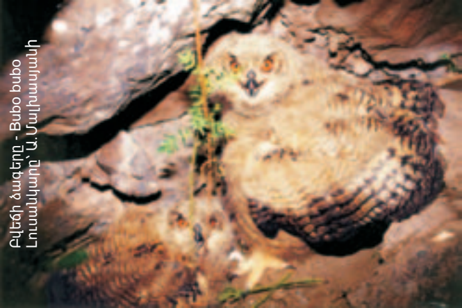
Բվեճի ձագերը - Bubo bubo

հանդիպում են լեռնա-տափաստանային իծը, գյուղզան, ժայռային մողեսը, դեղնափորիկը, արեւմտյան վիշապիկը, խայտաբղետ սահնօճը, երկարոտ սցինկը և այլն: Այստեղ կան երկկենցաղների 5 տեսակներ: