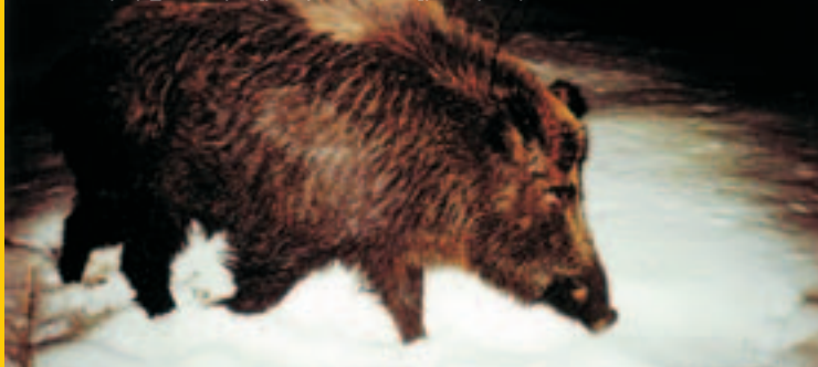
Վայրի խոզ - Sus scrofa

Սովիչի խոնդատը, վարդակակաջ ցեղի բուրբ սերկայացուցիչները, Վավիլովի աշորան, սովորական ունաբը եւ այլն /ընդամենը՝ 52 տեսակ/: