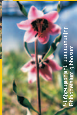
Կնճիթաբլթեղիկ սապատավոր Rhinopetalum gibbosum