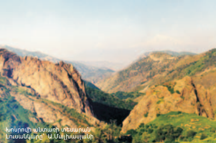
Խոսրովի անտառի տեսարան

ցախակեռասը, սովորական բռնչին, տանձենու ավելի քան 7 քսերոֆիլ տեսակ եւ արոսենու՝ Հայաստանում տարածված 12 տեսակից 9-ը: Հանդիպում է հատկապես ասորենու սովորական տեսակը՝ ծոփ խնձորը: