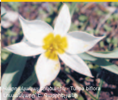
Վարդակակաչ երկձաղիկ - Tulipa biflora