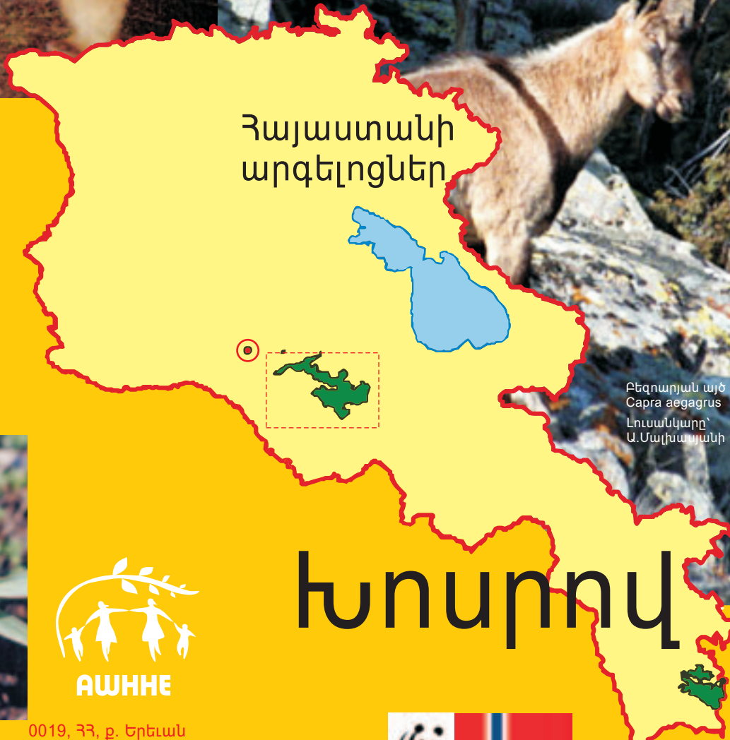
Բեզդարյան այծ Capra aegagrus