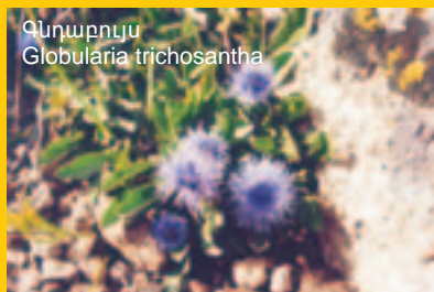
Գնդաբույս Globularia trichosantha