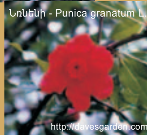
Նռնենի - Punica granatum L.