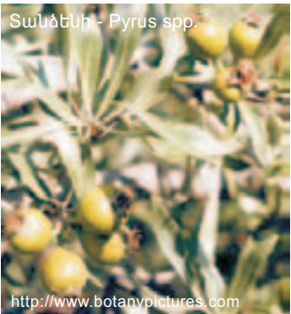
Տանձենի - Pyrus spp.

Արգելոցի բուսաշխարհն ընդգրկում է 1074 տեսակ ծաղկավոր բույս: Արգելոցում աճող մոտ 70 տեսակ գրանցված է Հայաստանի, իսկ 18-ը՝ Նախկին ԽՍՀՄ Կարմիր գրքերում: Արգելոցում աճում են էնդեմիկ շատ տեսակներ, որոնցից շատերը կոչվում են Չանգեզուր տեղանունով, օրինակ՝ տանձենի Չանգեզուրի, գանգակածաղիկ Չանգեզուրի, շնկոտեմ Չանգեզուրի, մորենի Թախտաջանի, վարդակակաչ խճճված, Ստեւենի եւ հայկական