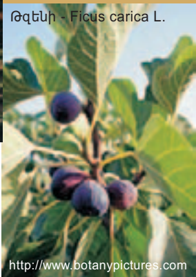
Թզենի - Ficus carica L.