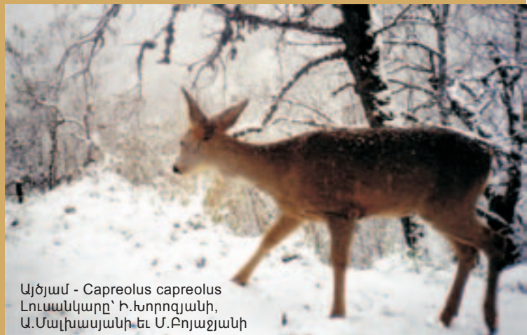
Այծյամ - Capreolus capreolus

Արգելոցի ստորին լեռնային գոտում, մինչեւ 1000 մ բարձրությունը, տարածվում են արաքսյան կաղնու ցածրահասակ ծառուտները եւ միջերկրածովյան բուսականության շատ հետաքրքիր մի տիպ՝ շիբլյակը: Վերջինիս ուղեկցում են սովորական դրախտածառը, մերկ փռնին, սովորական ծորենին /կծոխուր/ եւ այլ չորակայուն թփեր եւ նույնքան էլ չորակայուն շիբլյակին հատուկ խոտածածկ, ուր գերակշռում է սովորական միրուսաբույսը /կծմախոտ/՝ իր բարձր, ընդհանուր հասկակոթի վրա մատնածեւ տարածված, երկար թելանման հասկերով: