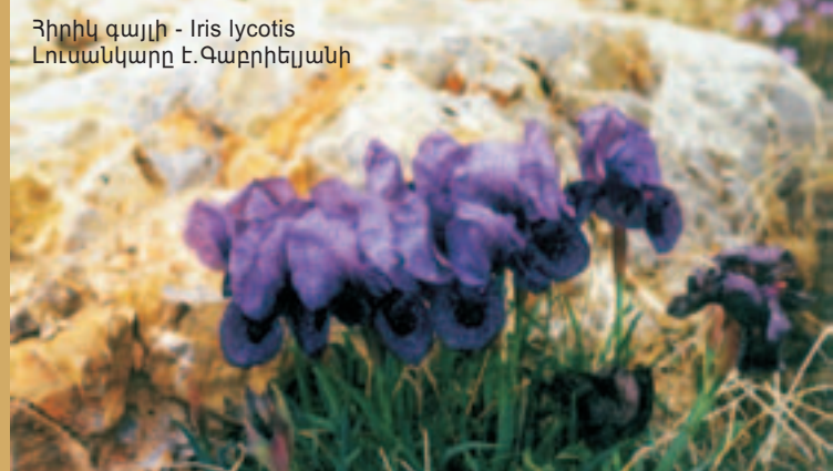
Հիրիկ գայլի - Iris lycotis

Բոխուտները տարածվում են հյուսիսային դիրքադրության լեռնալանջերին: Արգելոցում գտնվում է արեւելյան հաճարենու՝ Հարավային Հայաստանում միակ անտառակը: Անտառներում շատ են վայրի պտղատուները՝ հունական ընկուզենին, տանձենին, արեւելյան խնձորենին, սալորենին, ինչպես նաեւ մի շարք ջերմախոնավասեր ծառաթփային տեսակներ՝ բթատերեւ պիստակենին, ցանովի շագանակենին, կովկասյան խուրման, բոխատերեւ զելկովան, սովորական նռնենին, սովորական զկեռը, թզենին եւ այլն: