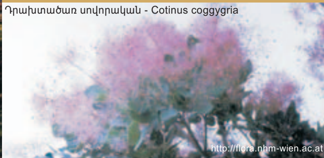
Ղրախտածառ սովորական - Cotinus coggygria

Արգելոցի բուսականության հիմնական տիպը՝ անտառը, տարածվում է 1000 - 2200 մ բարձրությունների վրա եւ կազմված է վրացական ու խոշորառեջ կաղնու, սովորական ու արեւելյան բոխու տեսակներից: Որպես ուղեկցող տեսակներ հանդես են գալիս հացենին, լորենին, թխկին, թեղին /ծփի/: