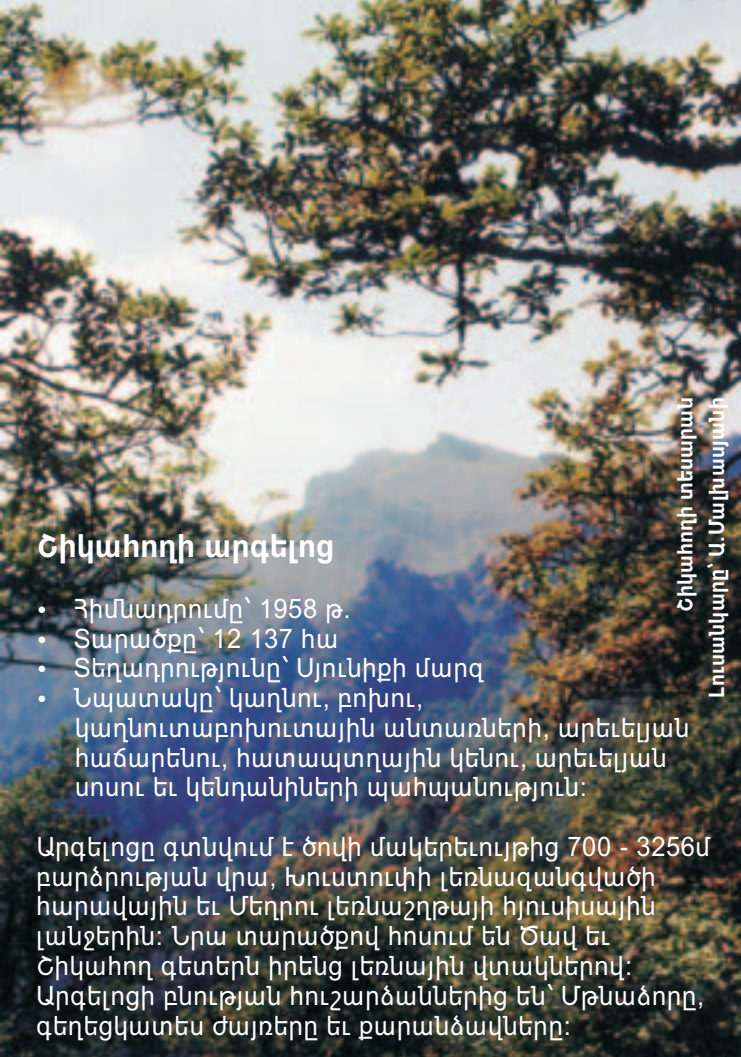
Շիկահողի տեսարան